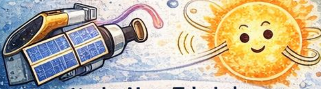
Kepler Uzay Teleskobu