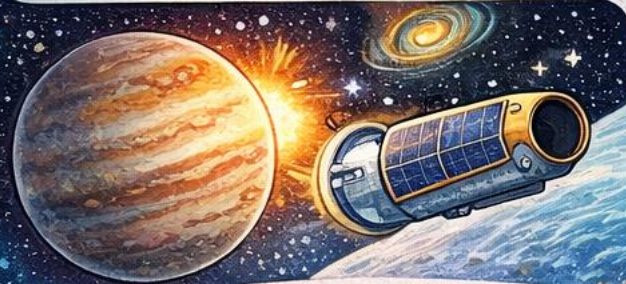
Kepler Uzay Teleskobu